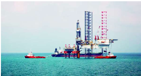
Plataforma de exploração de petróleo em águas profundas

A Advocacia Geral da União-AGU emitiu parecer alegando que o Instituto Brasileiro de Meio Ambiente - IBAMA, não possui prerrogativa para avaliar e licenciar do aeroporto de Oiapoque, um dos entraves para a não liberação da exploração de petróleo na costa do Amapá.