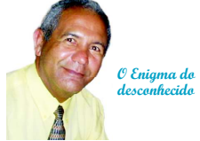
Alcântara - Advogado e Jornalista