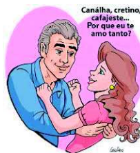
Caninha, cretino, cafajeste... Por que eu te amo tanto?

Caiu uma brisa fina do tipo de uma garoa olhei para o céu e vi a lua do tamanho de quarto crescente. O meu relógio me chamou a atenção ao despertar.